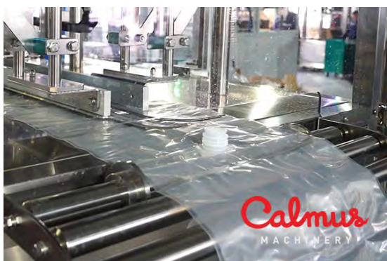
Постоянный ввод пустых мешков