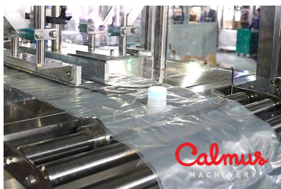
Постоянный ввод пустых мешков